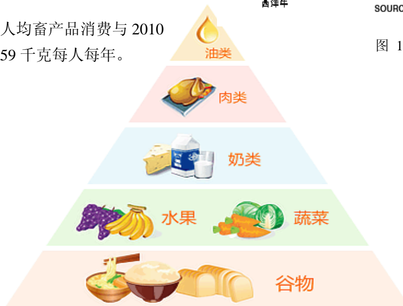
图 2 饮食结构